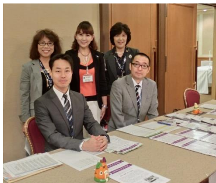
ポート神戸クラブ担当の受付