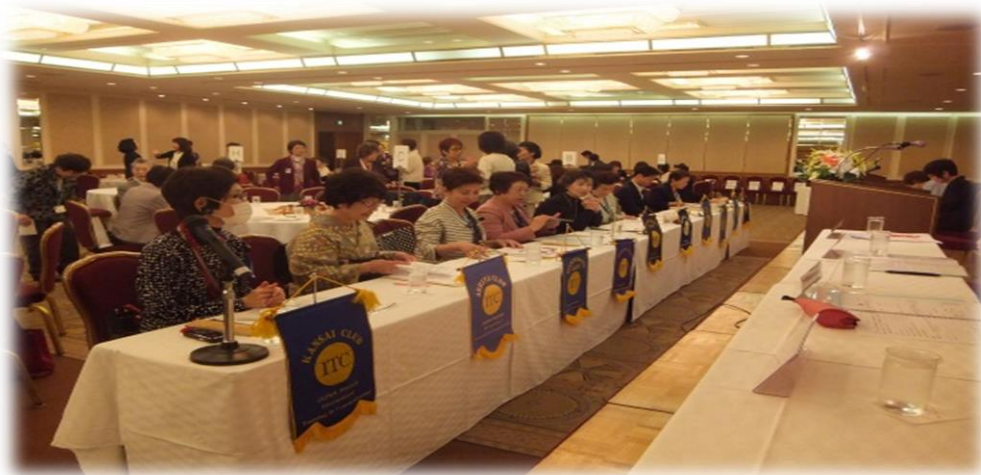
準備万端の 10 クラブ派遣員